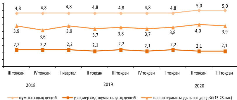
Сурет 2 – Жұмыссыздық деңгейі

2-суретке келетін болсақ, мұнда 2020 жылғы III тоқсанда ерлердің жұмыссыздар санындағы үлесі 45,2 % (205,4 мың адамды), әйелдердің үлесі – 54,8 % (249,4 мың адамды) құрады. 15–28 жастағы жастардың үлесі 18,3 % немесе 83,3 мың адамды құрады. 15–28 жастағы жастар жұмыссыздығының деңгейі 3,9 % болды [5].