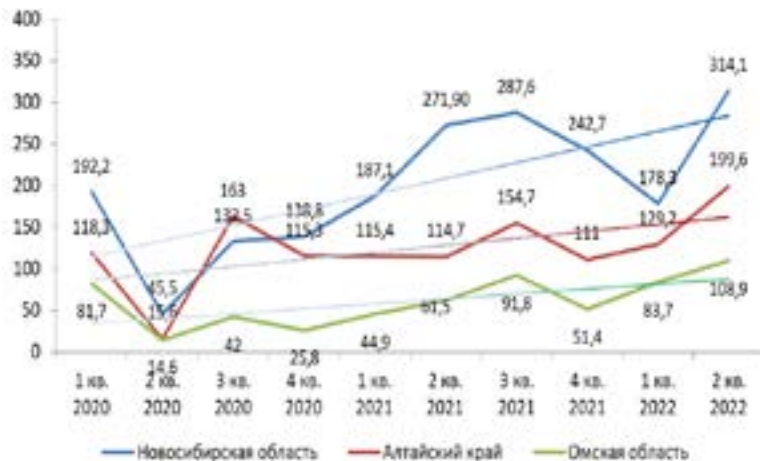
Рисунок 2 – Динамика количества туристов в коллективных средствах размещения по кварталам в 2020-2022 годах [5]

Как видно из рисунков, несмотря на серьезные потрясения в начале 2020 года во второй половине года гостиничная индустрия в России, и, в частности, в Сибирском регионе, взяла хороший темп на восстановление. В условиях закрытых границ и ограничений на выезд жители России обратили внимание на отдых внутри страны. Причем популярностью стал пользоваться не только юг, но и Сибирь [6].