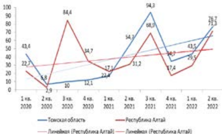
Рис. 3 – Динамика количества туристов в коллективных средствах размещения по кварталам в 2020-2022 годах [5]

Так, количество размещенных туристов в гостиницах Томской области и Алтайского края в 4 квартале 2020 года практически достигло уровня аналогичного периода 2019 года, а Новосибирской области превысило аналогичный период 2019 года на 38,8 %, в Омской области – на 78,5 %, в Республике Алтай – в 2,7 раза [6].