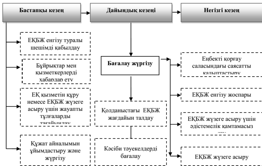
Сурет 1 – Еңбекті қорғауды басқару жүйесін кәсіпорындарға енгізу Әдістемесінің құрылымы

Әдістеме жұмыс берушілер үшін еңбекті қорғауды басқару жүйесін енгізу және қолдау бойынша нұсқаулық ретінде әзірленді. Бұл әдістеме, еңбек қауіпсіздігі және еңбекті қорғауды басқару жүйесінің барлық элементтерін ескере отырып, енгізуді нәтижелі ұйымдастыруға, жауапты тұлғалардың міндеттерін бөлуді және іс-шаралар мерзімдерін айқындауға мүмкіндік береді.